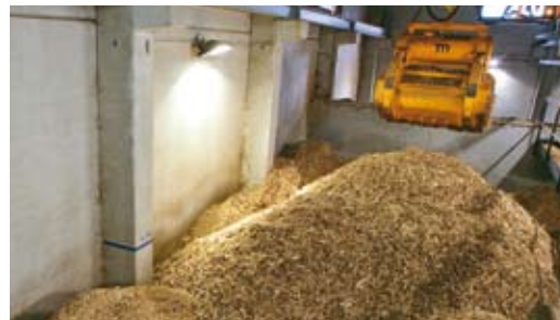
Silo à grappin 300 m 3 utiles