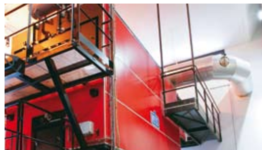
Chaudière bois 2,5 MW

Une alternative durable pour vos projets