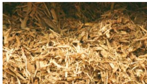
Plaquettes forestières Consommation annuelle de 2400 tonnes