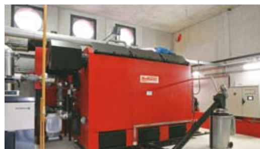
Chaudière bois 1,25 MW avec décendrage automatique

Partenaires : ADEME, CONSEIL RÉGIONAL D'ALSACE, CONSEIL GÉNÉRAL DU BAS-RHIN